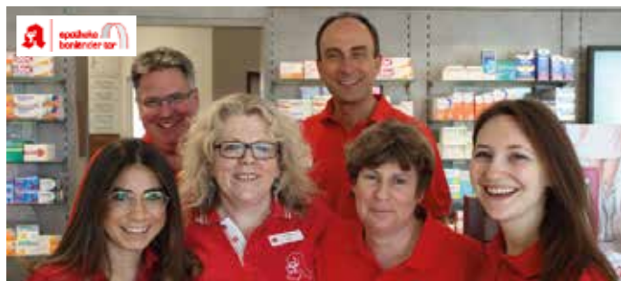
Das Team der Apotheke am Bonländer Tor in Filderstadt-Bonlanden berät kompetent auch rund um Homöopathie.

Heute nutzen allein in Deutschland über 30 Mio. Menschen Homöopathie (forssa-Umfrage 2020). Darüber hinaus ist sie eine weltweit verbreitete Therapieform. Der Begründer der Homöopathie,